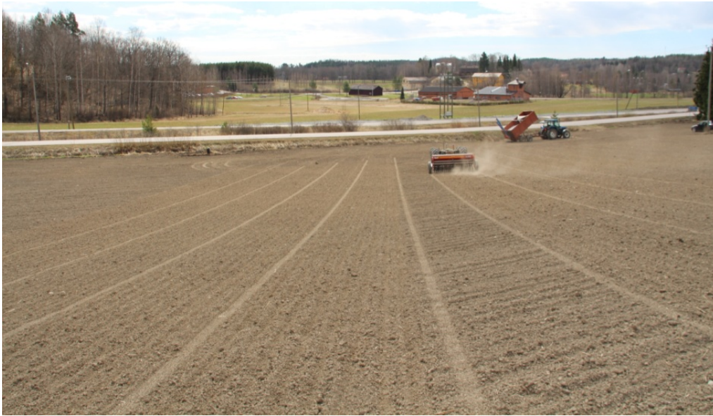
Kuva 4. Autonominen kylvö käynnissä pellolla 2. Säiliöt täytettiin manuaalisesti täyttövaunusta.

Autonomisen traktorin langaton kauko-ohjain oli toinen haaste autonomiselle toiminnalle. Technion Oy:n toimittamassa kauko-ohjaimessa on hallintavipuja koneen manuaalista käyttöä varten sekä integroitu hätäseis-toiminto jolla koneen toiminta saadaan sammutettua. Valmistaja käyttää 2,4 GHz taajuusalueita langattomassa tiedonsiirrossa vyölle kiinnitettävän kauko-ohjaimen ja työkonene välissä; valmistaja sanoo että protokolla perustuu IEEE 802.15.4 standardiin. Valmistaja myy kauko-ohjainta esimerkiksi nostureiden ohjaamiseen, joten turvallisuus on tärkeä sisäänrakennettu ominaisuus. Siksi langaton yhteys pitää olla jatkuva ja tiedon siirtyä molempiin suuntiin. Jos jompikumpi pää havaitsee tiedonsiirron katkeamisen, työkonene menee turvalliseen tilaan, mikä tässä tapauksessa toteutettiin niin että kaikista ohjausyksiköistä, myös, dieselmoottorin ohjaimesta, katkaistaan virransyöttö ja väistämättä moottori sammuu ja kaikki liike pysähtyy.