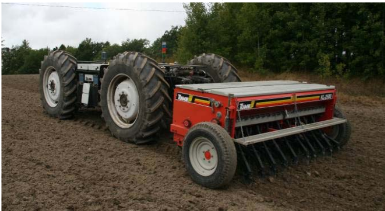
Kuva 2. APU-Module ja Tume KL-2500 kylvölannoitin peltorobottikokeessa.

Kylvöä varten traktori varustettiin Tume KL-2500 nostolaitekiinnitteisellä kylvölannoittimella. Kylvölannoittimessa lannoite sijoitetaan erillisillä vantailla, väli 25 cm ja siemenvantaiden väli on 12,5 cm. Kylvölannoittimen työleveys on 2,5 m, joten koneessa on 20 siemenvannasta ja 10 lannoitevannasta. Kylvövantaat ovat laahavannas-tyyppisiä. Käytetyssä 25 vuotta vanhassa erinomaisessa kunnossa olevassa työkonessa ei ollut elektronisista laitteita. Säiliöt täynnä kylvölannoitin painaa noin 1450 kg, mikä ei aiheuttanut käytetylle traktorille ongelmia. Traktorin teho ja nostolaitteen voima mahdollistaisivat leveämänkin koneen, mutta tämä oli ainoa käytettävissä ollut vaihtoehto tähän peltorobottikokeeseen.