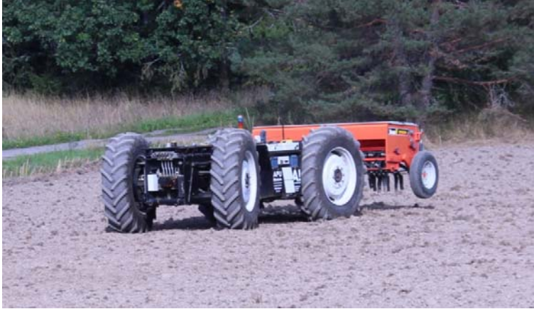
Kuva 1. APU-Module, autonominen traktori

käynyt täydellisen sähkö- ja elektroniikkaremontin; vuosina 2009-2012 kehitetty elektroninen ohjausjärjestelmä, paikannusjärjestelmä, hydraulikan säätöjärjestelmä ja navigointijärjestelmä on kuvattu tarkemmin lähteissä Oksanen (2012a; 2012b), Oksanen & Backman (2013) ja Oksanen & Linkolehto (2013).