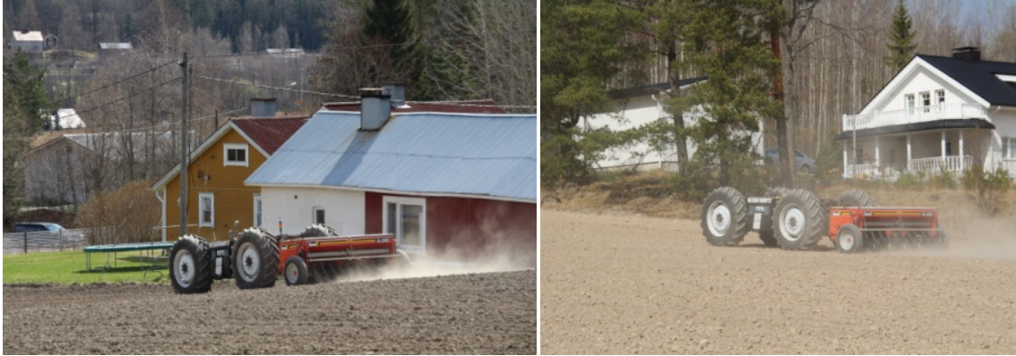
Kuva 5. Asuinrakennuksia pellon 3 ympärillä. Kotitaloudessa käytettävät kuluttajalaitteet saattavat käyttää 2,4 GHz taajuusalueita langattomaan tiedonsiirtoon.

Peltorobottikokeessa käytetty prototyyppi sisältää paljon ns. perustekniikkaa, vastaavanlaista mitä mistä tahansa traktorista löytyy, kuten moottorin syöttöpumppu, siirtopumppu, suodattimet, hydraulikkapumput, lauhduttimet, säiliöt, moottoriin ja polttoaineeseen liittyvät anturit yms. Aina on riski, että perustekniikka voi peltorobotissa vaurioitua. Tämä riski realisoitui peltorobottikokeen viimeisellä pellolla, kun vain puoli hehtaaria oli jäljellä, hydraulikkajärjestelmän öljyvuoto pakotti lopettamaan kokeen. Tämän vuoksi peltorobottikokeen kokonaispinta-alaksi tuli 6,1 hehtaaria.