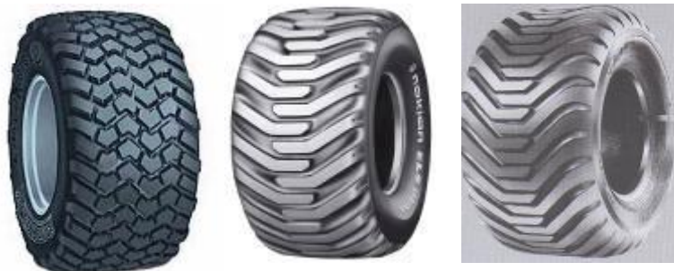
Taulukko 1. Vertailtavat renkaat ja käytetyt rengaspaineet