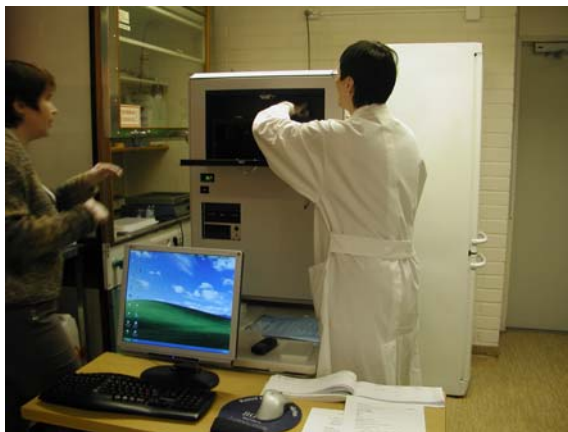
Kuva 1. Konenäkölaitteen kasvatuskammioon ollaan asettamassa alkiokasvatusmaljaa.