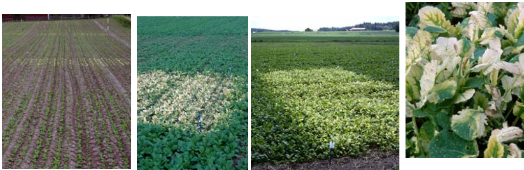
a) b) c) d)

Kuvat 2 a)–d). Kuvassa a) ennen vaaleaa kummatsonilla (Centium CS) käsiteltyä ruutua on taimettumisen jälkeisen metatsaklori –käsitteilyn (Butisan-valmisteet) voittamaa kasvustoa. Kuvassa b) voittumattoman kasvuston viereisen kloroottisen kummatsoni-ruudun (Centium CS) jälkeen erottuu amidosulfuronin (Gratil) voitus. c) 27.6.2003 alkaa jo uusi kasvu nousta kummatsoni-voituksen alta. Lähikuva d) rypsin 2–3 lehtiasteella käytetyn kummatsonin voituksesta.