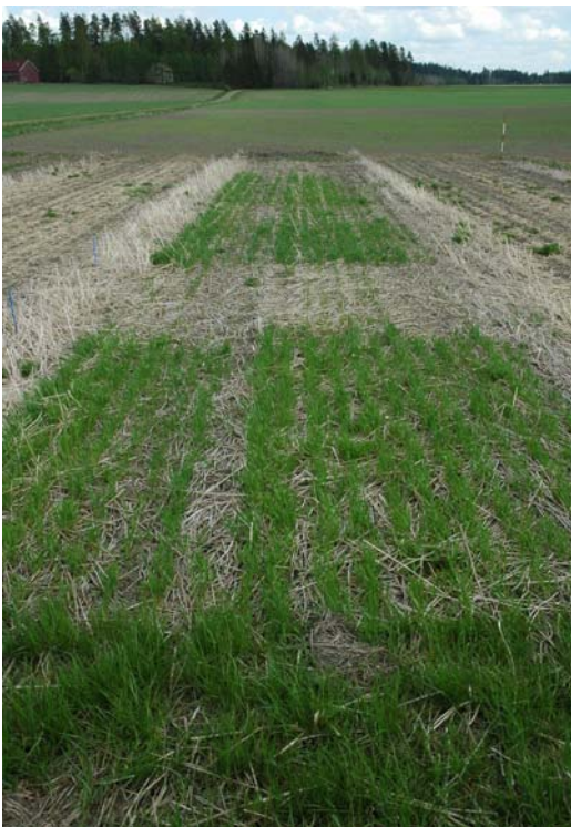
Kuva 4. Alue, jolta rikkakasvien torjuntaan on käytetty napropamidia 1,8 kg/ha erottuu harvana.

Kenttäkokeessa napropamidin käyttömäärän kaksinkertaistaminen käyttöohjeen mukaisesta ei alentanut suorakylvetyyn syysvehnän taimettumista. Kuitenkin kaksinkertainen käyttömäärä (1,8 kg/ha) esti syysvehnän versominen seuraavana kesänä (kuva 4).