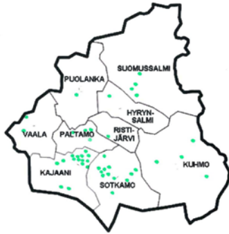
Kuva 1. Viiden tai useamman hevosen tallien sijainnit Kainuussa.