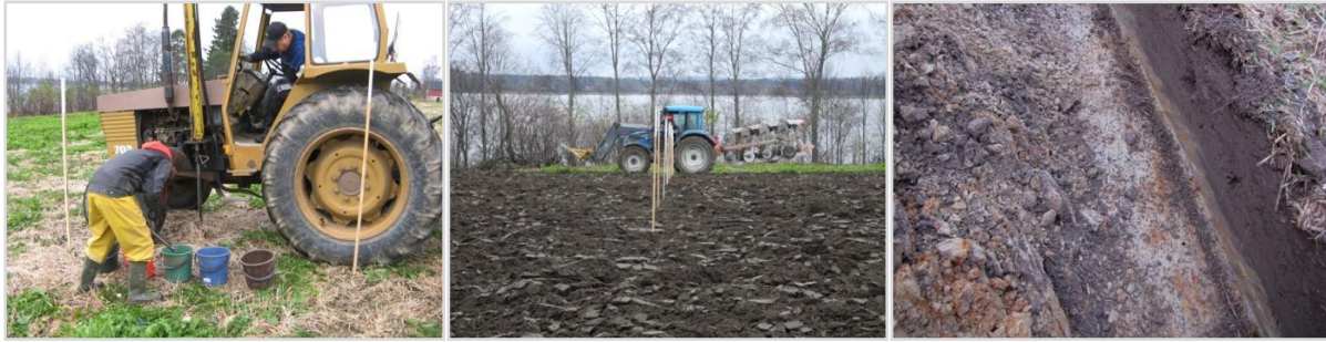
Kuva 1. a) Maanäytteenotto traktorikairalla, b) kyntötulos ja näytteenottolinja ja c) kyntöjäljestä paljastuva pohjamaa.