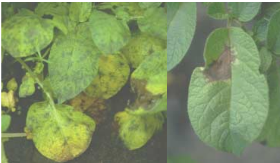
Kuva 1. Maasta tarttuvan rutan aiheuttamaa mosaiikkimaista kirjavuutta perunan alalehdissä (oikealla) ja tyypillinen ilmavintäisen rutan aiheuttama kuoliolaikka ylälehdessä (vasemmalla)

Ruton ensioireet ilmenevät nykyisin usein maahan koskettavissa alalehdissä mosaiikkimaisena kirjavuutena tavallisten kuoliolaikkujen sijasta. Tällaisista kasvustoista kerätyissä ruttopopulaatioissa A1/A2 parittelumuotojen suhde on 50/50 ja isolaattien välinen perinnöllinen diversiteetti on erittäin suuri, mikä on tyypillistä suvullisesti lisääntyvälle populaatiolle.